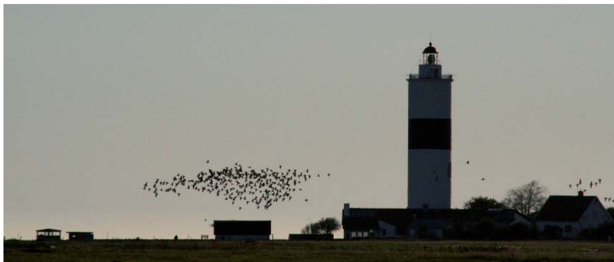
Ölands södra udde med Långe Jan under fågelskådningen vecka 41.