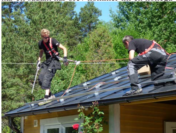
Montage av solceller på Sjöbacken t.v. Norrskan t.h.